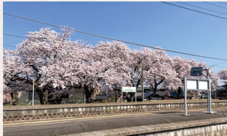
JR分水駅 燕市分水桜町一丁目

※4/15●燕さくらマラソン大会開催中は周辺交通規制があります。ご注意ください。