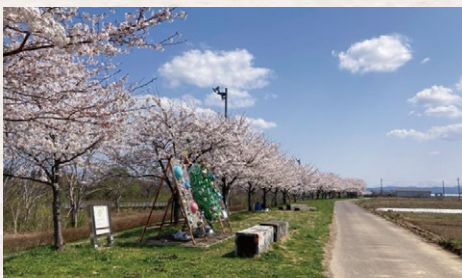
大曲河川公園 燕市大曲4258-2