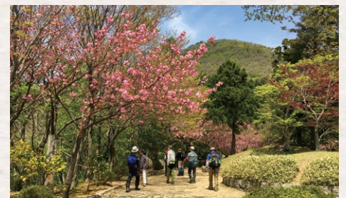
国上山 燕市国上1405-15 (燕市分水ビジターサービスセンター)