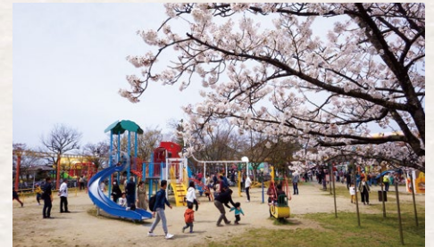
燕市交通公園 燕市大曲3375