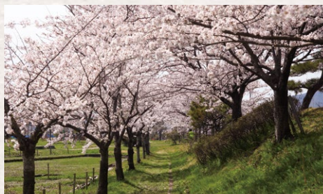
吉田ふれあい広場 燕市大保466